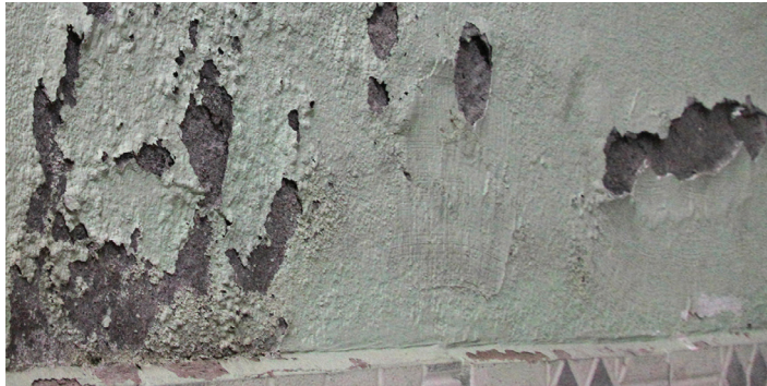
Pred použitím SikaMur® System